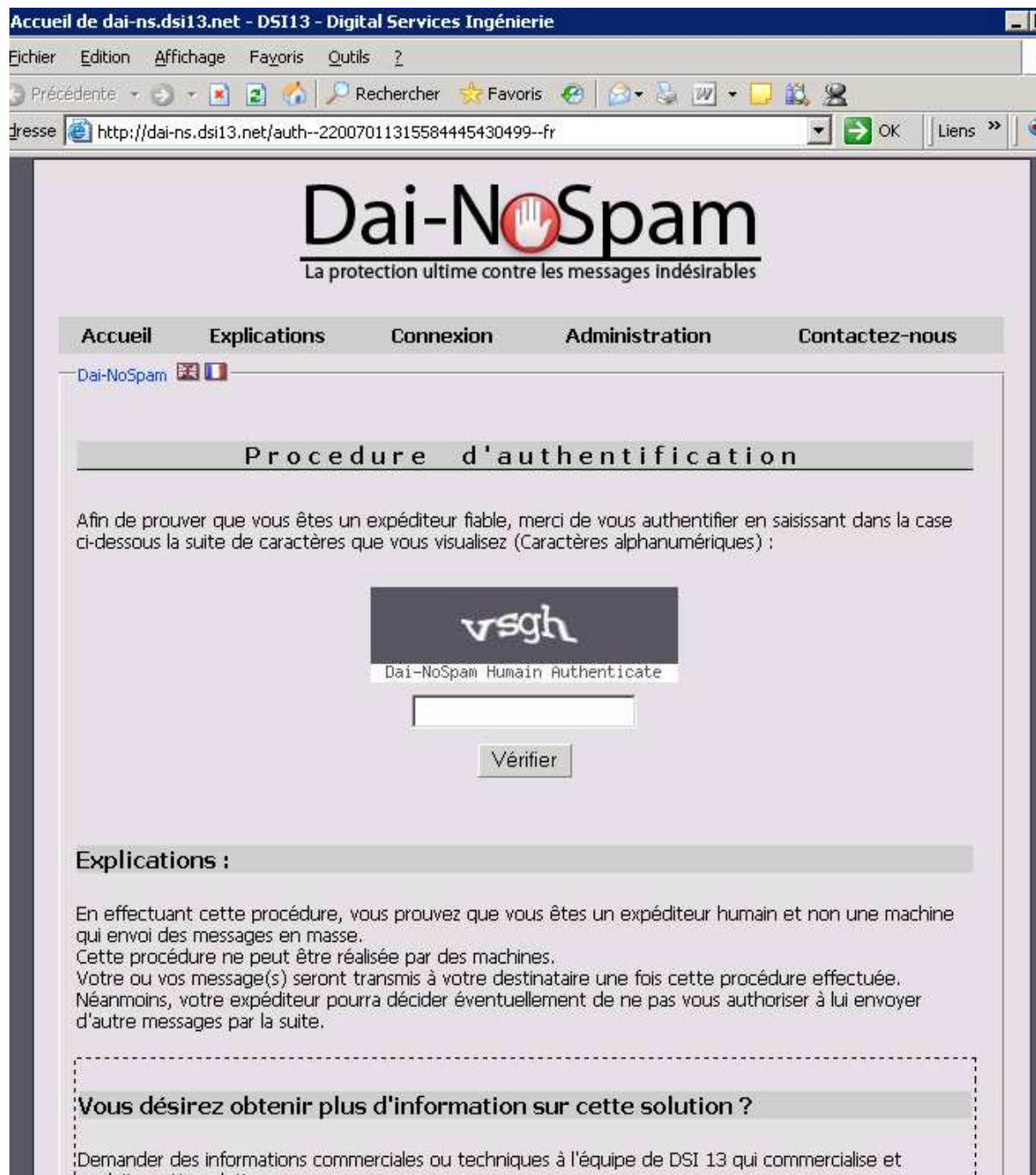
Illustration 2 : Authentification de l'expéditeur.

Une fois que l'expéditeur clique sur le lien, la page d'authentification apparaît :