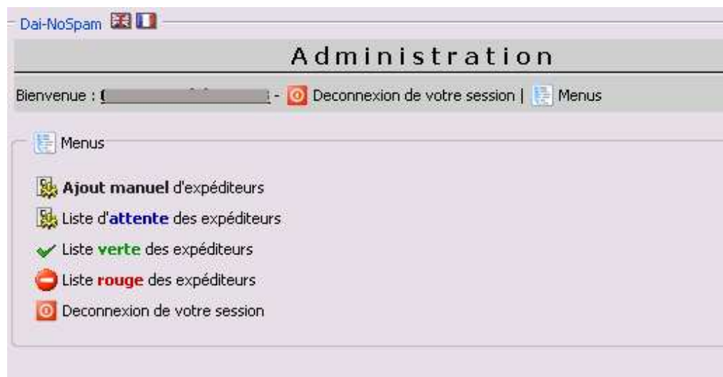
Illustration 4 : Administration : Liste des actions.

C'est aussi avec le portail de gestion de vos expéditeurs que vous pouvez gérer les files d'attente et autoriser manuellement certains expéditeurs qui ne sauraient s'authentifier comme les newsletters auxquelles vous vous seriez abonnés.